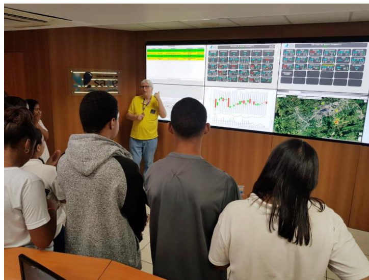
Figura 4: Foto dos alunos do C. Estadual Guanabara em Visita ao Centro de Controle Operacional do SAAE/VR

instalações do SAAE/VR mais precisamente no CCO (Centro de Controle Operacional) no primeiro semestre de 2023 conforme foto a seguir: