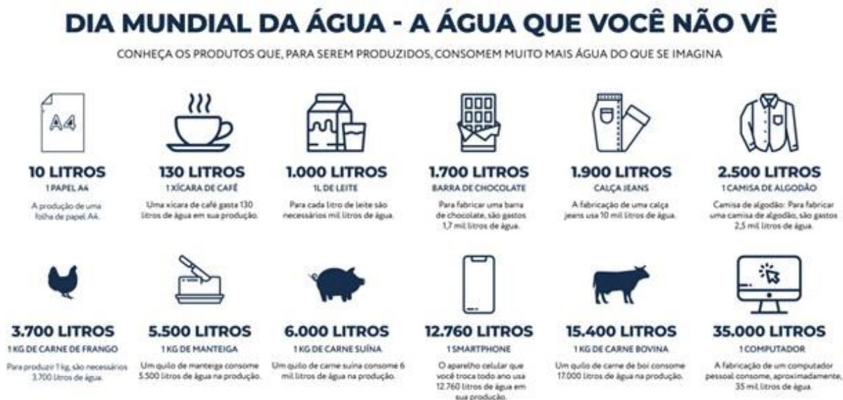
Figura 2: Produtos produzidos e seu consumo no processo