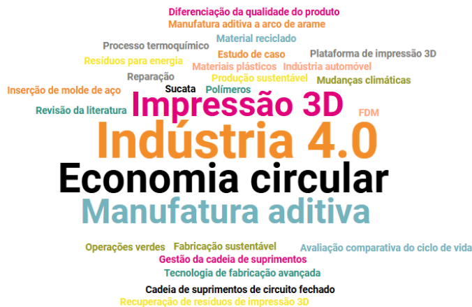
Figura 2: Nuvem de Palavras