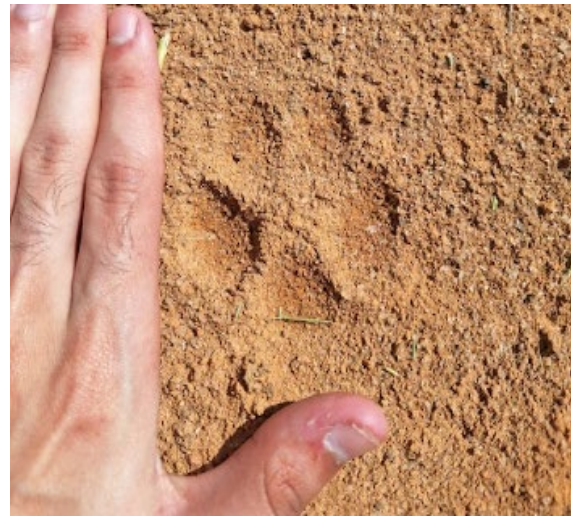
Figura 5: Rastro de Chrysocyon brachyurus .

Segundo Marins et al. (2025), a presença de ovos de Ancylostoma sp e Toxocara sp na amostra de lobo-guará sugere que a contaminação parasitária é uma evidência de contaminação ambiental. O ciclo de vida do Toxocara sp. é complexo e pode ocorrer por duas vias: a infecção direta, pela ingestão de ovos embrionados do solo contaminado, ou a via indireta, que é particularmente preocupante para o lobo-guará. O lobo-guará pode ser infectado ao predar e ingerir hospedeiros paratênicos, como pequenos mamíferos ou aves, que possuem larvas encistadas em seus tecidos. Já a infecção por Ancylostoma sp., cujos ovos são eliminados nas fezes do hospedeiro, pode ocorrer pela ingestão de larvas infectantes, que se desenvolvem no solo úmido, característico do ambiente de mata atlântica. As larvas podem penetrar a pele ou serem ingeridas, completando o ciclo. A ocorrência desses parasitas em um animal silvestre de vida livre serve como um "sentinela biológico", indicando a interface de risco entre o ambiente silvestre e o antrópico.