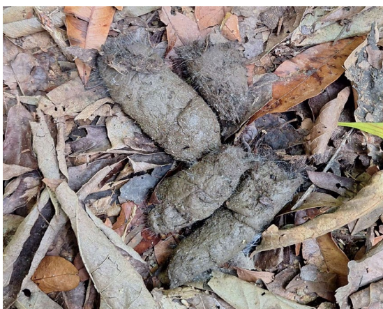
Figura 2: Fezes de Chrysocyon brachyurus .

Em relação a amostra fecal encontrada, foram identificados ovos de dois parasitos gastrintestinais: Ancylostoma sp. e Toxocara sp..