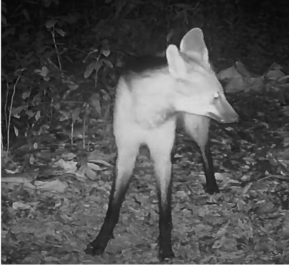
Figura 4: Imagens de armadilhas fotográficas.