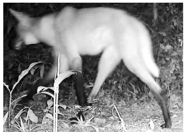
Figura 3: Imagens de armadilhas fotográficas.