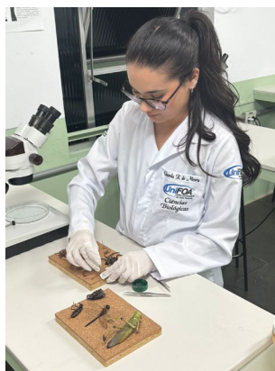
Figura 3 – Processo de separação e montagem provisória dos exemplares coletados.

Após as coletas, os espécimes foram preparados para montagem de acordo com suas características morfológicas. Insetos de corpo rígido foram fixados com alfinetes entomológicos atravessando o tórax sobre base de isopor ou cortiça. Espécimes delicados, diminutos ou de corpo mole foram preservados em álcool 70% (figura 3).