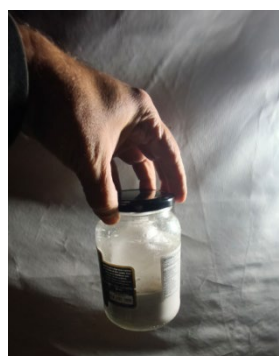
Figura 2 – Câmara mortífera.