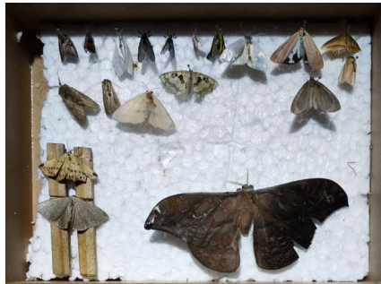
Figura 4 – Caixa entomológica provisória para montagem no campo.

(Arima, Maciel e Uhl, 2009; Silva & Link, 2000; Silva & Oliveira, 2022). Parte dos insetos coletados, em especial aqueles que apresentaram integridade, ou seja, não faltaram pedaços do corpo, foram alfinetados e depositados em caixas entomológicas provisórias (figura 4).