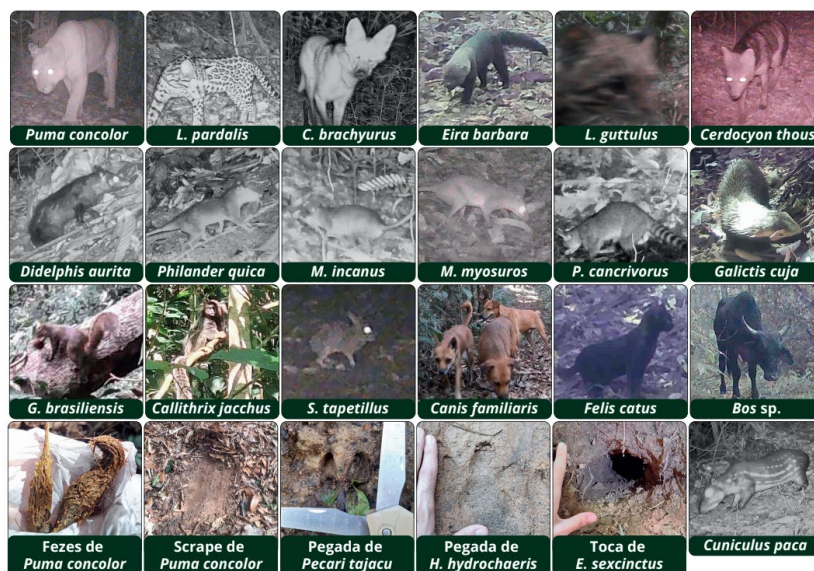
Figura 1: Registros obtidos por armadilhas fotográficas.

Entre os registros mais relevantes destacam-se: Felídeos: Puma concolor (onça-parda), Leopardus pardalis (jaguatirica) e Leopardus guttulus (gato-do-mato-pequeno). Canídeos: Cerdocyon thous (cachorro-do-mato) e Chrysocyon brachyurus (lobo-guará). Roedores e lagomorfos: Cuniculus paca (paca), Hydrochoerus hydrochaeris (capivara) e Sylvilagus tapetillus (tapiti). Procionídeos e mustelídeos: Procyon cancrivorus (mão-pelada), Eira barbara (irara) e Galictis cuja (furão). Espécies exóticas invasoras: Canis familiaris (cão doméstico), Felis catus (gato doméstico) e Bos sp. (gado bovino).