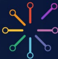
Figura 1 - Arte abstrata, geométrica e floresta de grafos