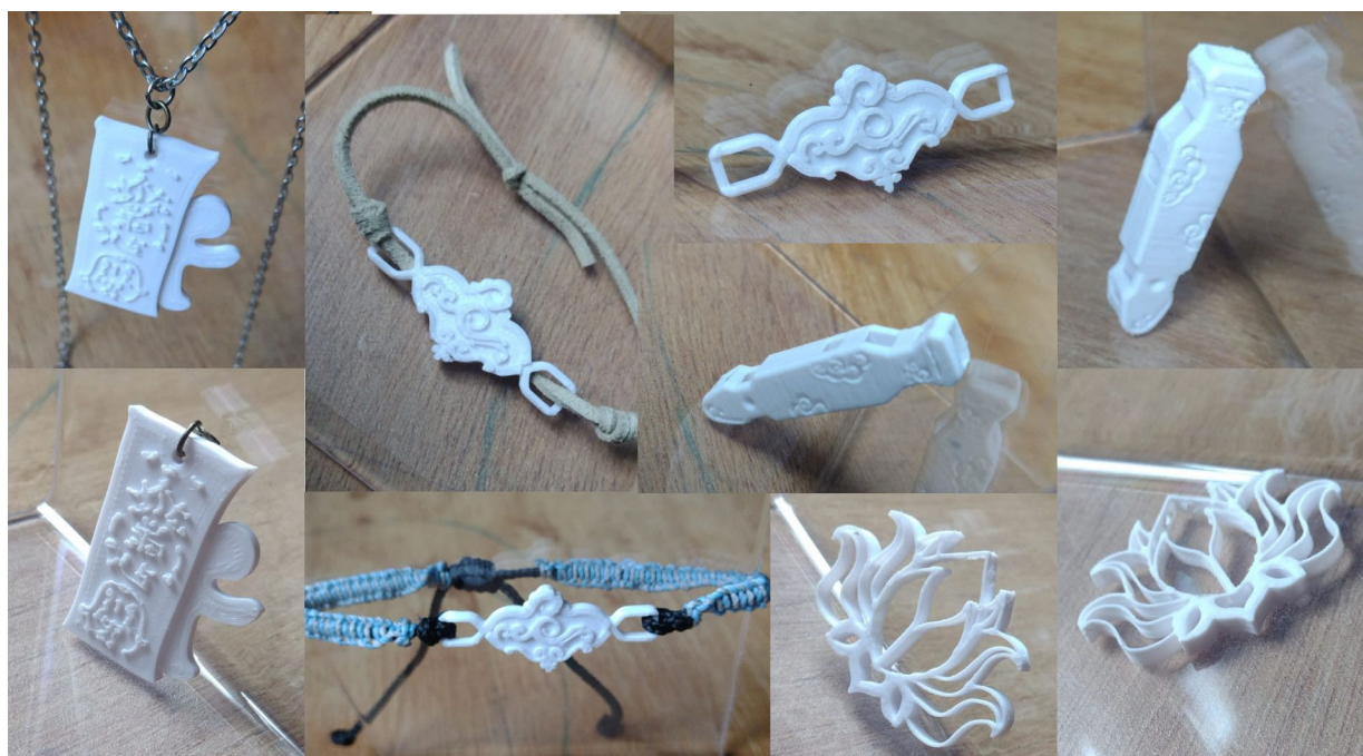
Figura 2: Peças impressas em 3D.

Os projetos mais bem avaliados na matriz foram selecionados para testes e, posteriormente, transformados em protótipos.