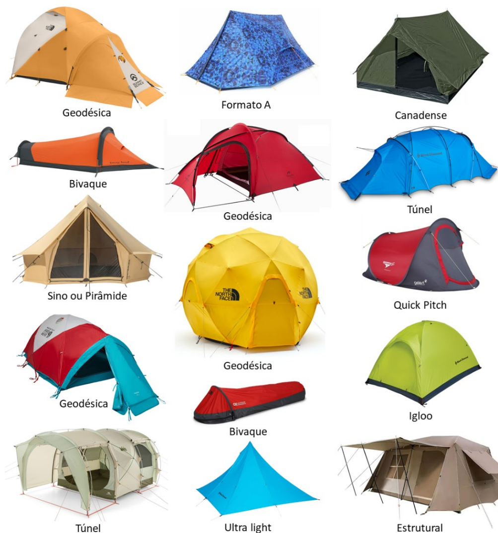
Figura 2: Categorias de barracas