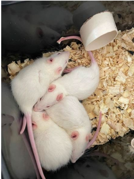
Figura 4 – Manipulação dos animais dentro da gaiola acoplada.