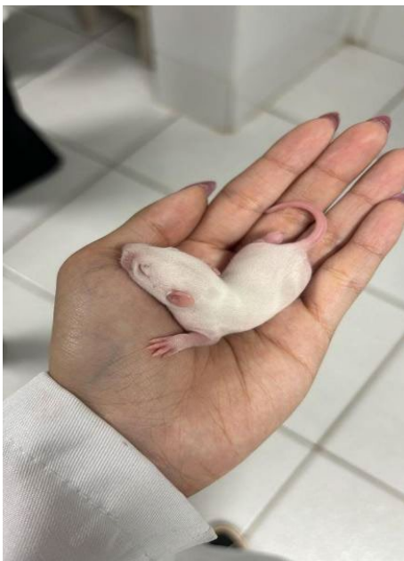
Figura 3 – Manipulação dos animais contidos na gaiola acoplada

Não foi observado diferença entre peso e ingestão de ração entre os animais mantidos na gaiola experimental e os animais controles que não apresentavam nenhuma alteração no protocolo padrão do biotério. Entretanto, ao serem contidos para higienização das gaiolas, os animais mantidos na gaiola acoplada eram mais calmos e menos agitados quando comparado aos demais animais (figura 3).