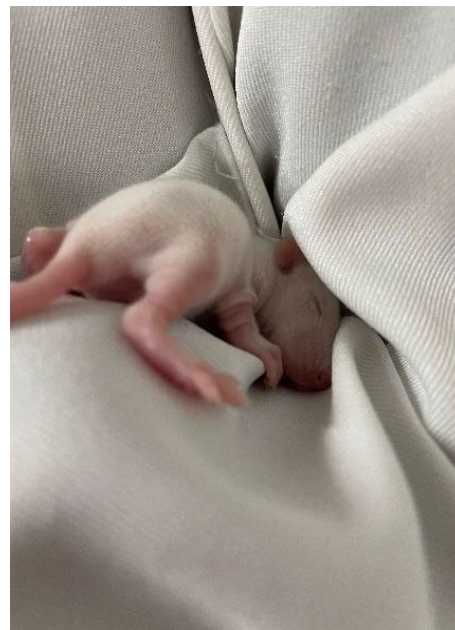
Figura 3.1 – Manipulação dos animais contidos na gaiola acoplada.