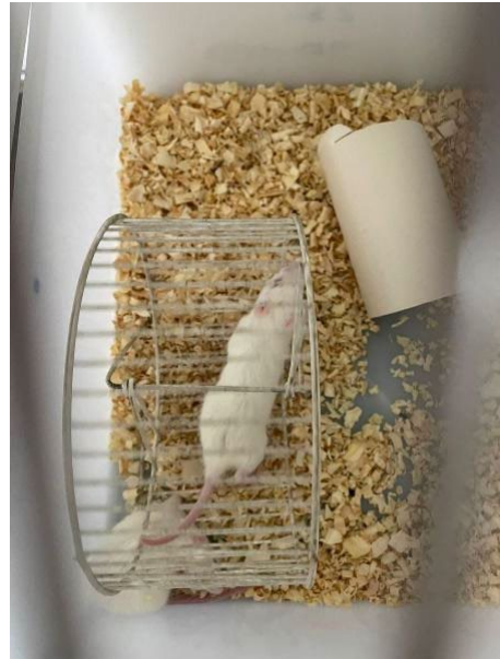
Figura 4.1 – Manipulação dos animais dentro da gaiola acoplada.